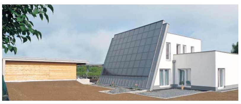
Das Sonnenenergiehaus in Oberkotzau.

Die Energiefragen der heutigen Zeit schreien nach Antworten. Mit dem ersten Sonnenhaus in Hochfranken, es steht in Oberkotzau, ist ein intelligenter Beitrag zur Energieversorgung durch Solarwärmespeicherung entstanden. Gerade für Wohngebäude werden die steigenden Energie- und Brennstoffpreise zum Problem. „Wir stehen mit unserer Arbeit in der Tradition der modernen Architektur und vertreten die Idee des angehenden 21. Jahrhunderts: Form follows energy!“, betont der Hofer Architekt Uwe Fickenscher. Was er