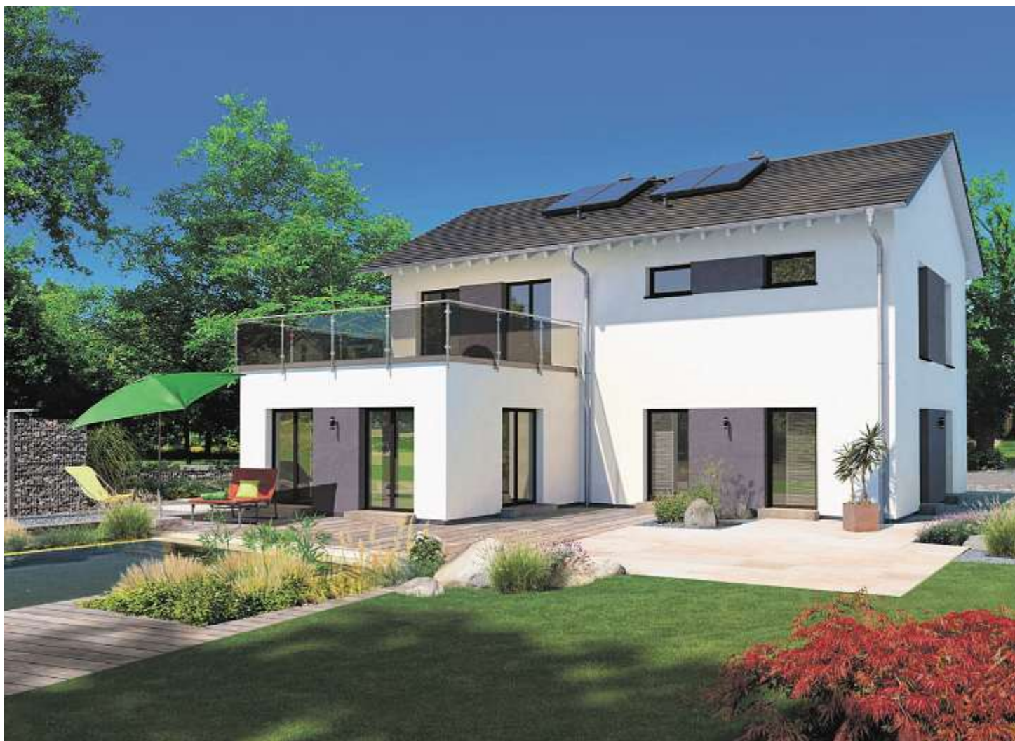
Wie können wir im Inneren für Frischluft sorgen, ohne die kostbare Heizwärme aus dem Fenster herauszulüften? Kontrollierte Be- und Entlüftungsanlage mit Wärmerückgewinnung bieten die optimale Lösung.