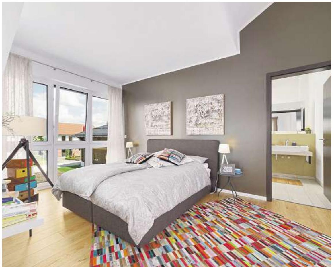
Ein gutes Raumklima ist auch im Schlafzimmer von Bedeutung. Die kontrollierte Be- und Entlüftungsanlage mit Wärmerückgewinnung sorgt für permanente Frischluft im ganzen Haus.