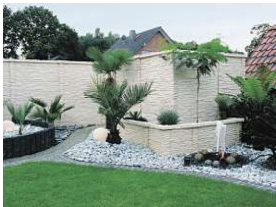
Modern und formschön: Beckers Betonzaun

„Unser Anliegen ist es, gemeinsam mit dem Kunden einen Lebensraum zu schaffen, in dem sich die Familie und Freunde erholen, Spaß haben und die Natur erleben können.“