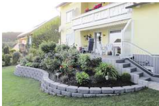
Treppenaufgang mit Hangabfangung

Einen Einblick, welche Möglichkeiten es gibt, die Wünsche vom eigenen Traumgarten umzusetzen, zeigt die Musterausstellung am Firmengelände in Vierschau. Bei einem Rundgang durch die 700 Quadratmeter große Ausstellung gibt es eine Vielzahl an Anregungen, die eigenen Ideen vom Fachbetrieb umsetzen zu lassen. Markus Kleine: „Ein Besuch lohnt sich immer, denn er bringt neue Inspirationen für die Neugestaltung oder Sanierung der Außenanlagen.“ Die enge Zusammenarbeit mit namhaften Herstellern bietet der Firma die Möglichkeit, eine große Auswahl an hochwertigen Produkten den Besuchern vorzustellen. „Mit unserer Erfahrung stehen wir Ihnen bei der erfolgreichen Umsetzung Ihrer Vorstellungen und Wünsche mit Rat und Tat zur Seite.“ sagt Markus Kleine. „Wir freuen uns auf Ihren Besuch!“