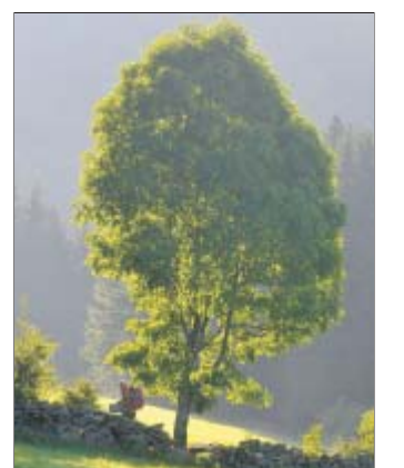
Eschen sind von einem Pilz bebroht.

München – In den südstädtischen Wäldern sind immer mehr Eschen krank und weisen Schäden an ihren Trieben auf. Es handle sich um das sogenannte Eschentriebsterben, eine Krankheit, die durch einen Pilzreger ausgelöst werde und die vor allem in Osteuropa und Norddeutschland verbreitet sei, teile das Forstministerium am Mittwoch in München mit. Der Pilz verstopft den Angaben zu-